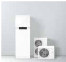
Vitocal 111-S: il sistema compatto per riscaldamento, raffrescamento e acqua calda a energia rinnovabile.

Riscaldare, raffrescare e produrre acqua calda sfruttando l'energia rinnovabile.